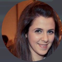
Rawaa Al Rishan