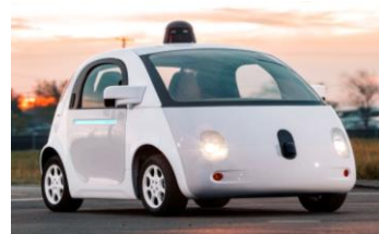
La Google Car